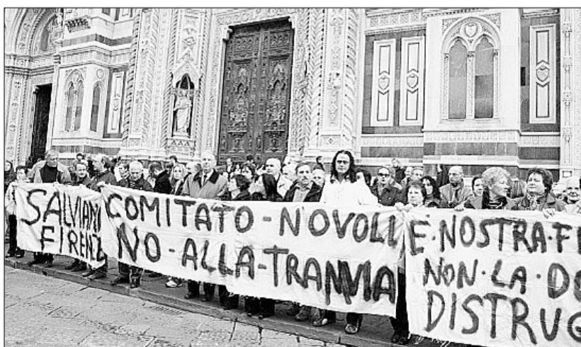
Una manifestazione contro la tramvia

FIRENZE - Scenderanno in piazza lunedì prossimo il comitato SalviamoFirenze e i sindacati Orsa, Ultrasporti e Sdl per protestare contro l'inizio dei lavori per la realizzazione della linea 3 della tramvia. Il presidio, fissato in viale Morgagni all'incrocio con via Santo Stefano in Pane, riporta all'attualità delle cronache le proteste contro la tramvia, che nelle ultime settimane hanno registrato notevoli successi, come la raccolta di oltre 12mila firme per richiedere un referendum consultivo sul tema. La manifestazione sarà quindi un'ulteriore occasione per fare il punto della situazione e cercare un momento di dialogo con le istituzioni cittadine. "Noi siamo sempre stati disponibili ad avanzare delle proposte - spiega Lanfranco Ricci, della segreteria di Ultrasporti - Non compete a noi fare i progetti, ma abbiamo avanzato delle proposte alternative a delle scelte che riteniamo inutili. A Fi-