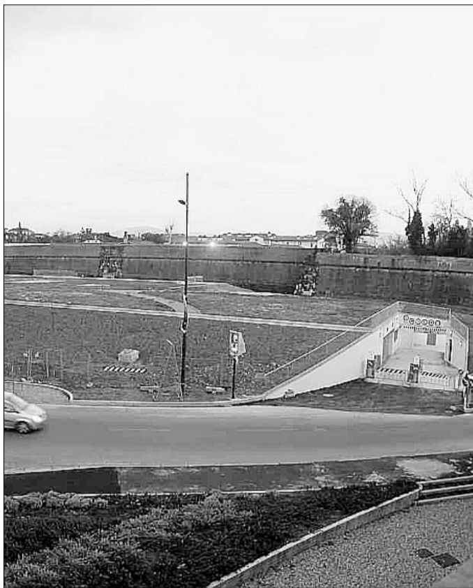
IL parcheggio della Fortezza